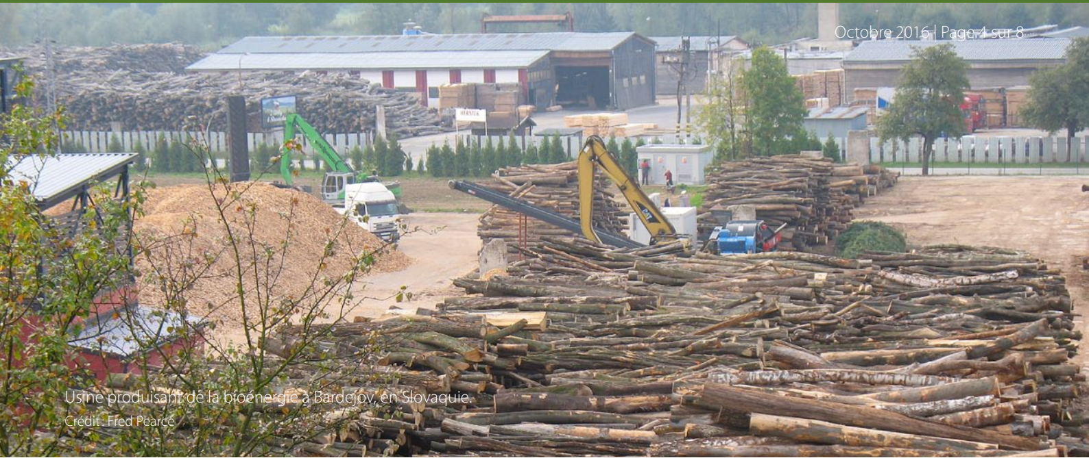
Usine produisant de la bioénergie à Bardejov, en Slovaquie.